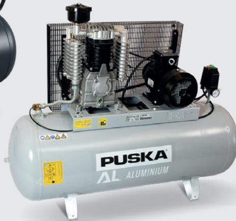
AL 100 500 3.264 €