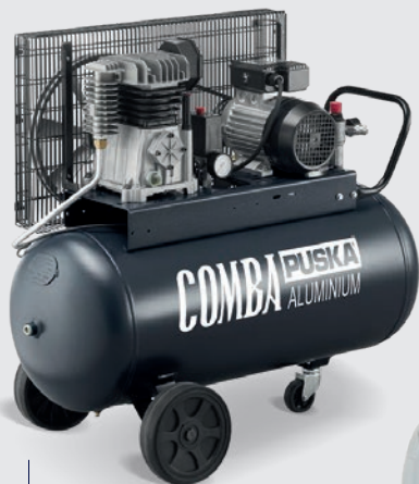
Comba 3200 R II 768 €