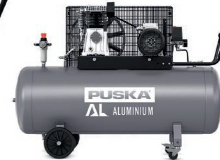
AL 30 200 R II