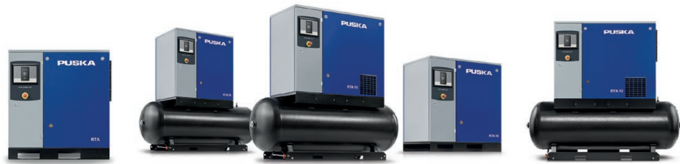
RTA 20 10