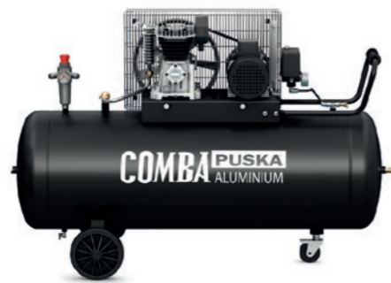
Comba 3200 R II