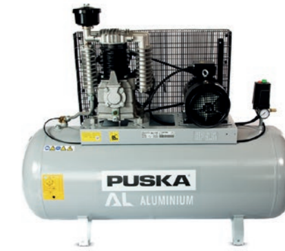
AL 55 300

Los compresores PUSKA de la gama AL son la evolución de los compresores de pistón por correas y aportan aún más robustez y eficiencia a nuestra gama de productos especialmente diseñados para profesionales y talleres que requieren un uso intermitente de herramientas neumáticas o compresores de aire. Características como cilindros de hierro, con una eficiente refrigeración, así como su baja velocidad y temperatura de funcionamiento te garantizan fiabilidad y una larga vida útil.