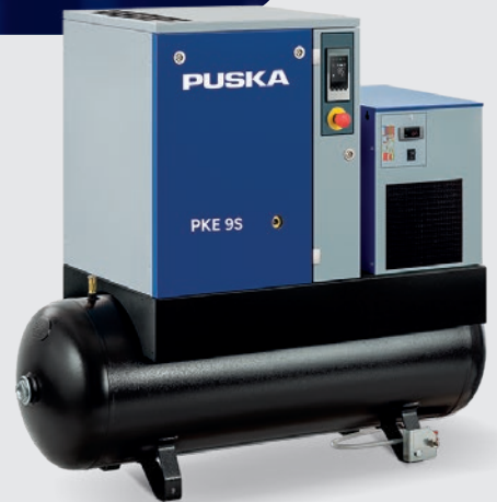
PKE 9S 10 270 C 5.862 €