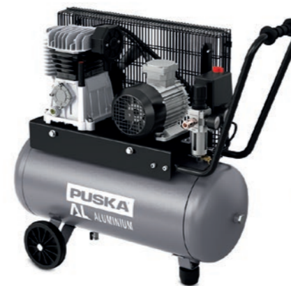
AL 20 50 R II

R: Incluye ruedas. Ofertas válidas hasta el 31 de julio de 2025. Impuestos no incluidos.