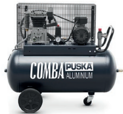
Comba 2100 R II