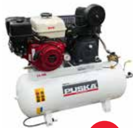
TG-530-2-100 5,5 hp, 100 litros

Ofrece una protección completa. Fácil de transportar, fácil de mover