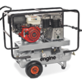
engineAIR 5/11+11R Petrol 4,8 hp, 11+11 litros

Para un desplazamiento sencillo en terreno difícil