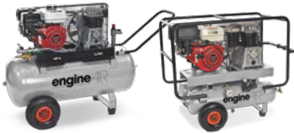
engineAIR 5/100 Petrol 4,8 hp, 50 litros

Tirador ergonómico y neumáticos de gran tamaño