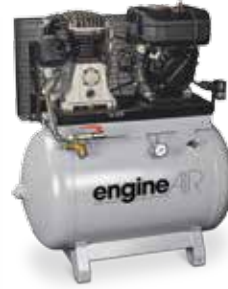
engineAIR 11/270 Diesel 10,9 hp, 270 litros

Único con cabezal 100% de hierro fundido, larga vida útil y menor ruido