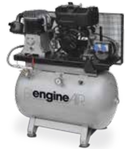
BI engineAIR 11/270 Diesel 2KVA 10,9 hp, 2KVA, 270 litros

Para un transporte y uso sencillos allí donde se necesite