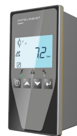
NUEVA TARJETA ES4000 Basic