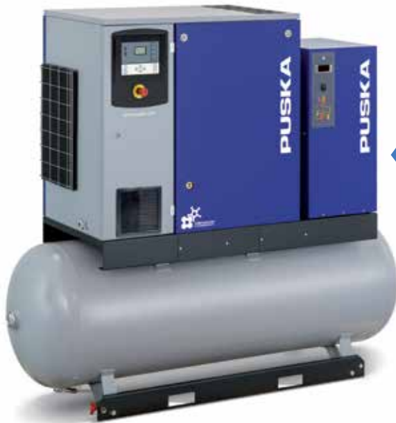
Ready RTA D 20 – 500 VF

Fácil mantenimiento y accesibilidad. Comodidad del usuario. Fiabilidad y larga vida útil. Ahorro gracias a un rendimiento Eficiente. Y además con la calidad del SERVICIO PUSKA