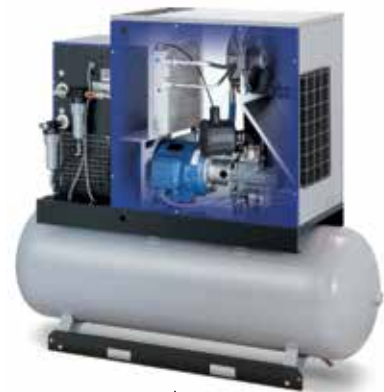
RTA D 20 VF